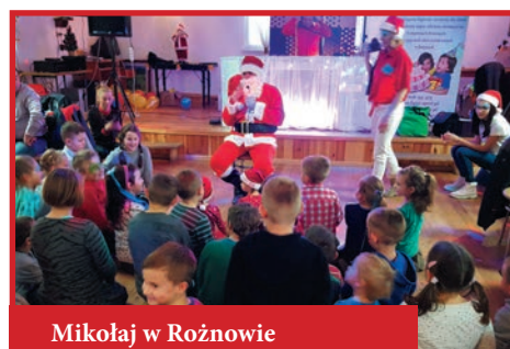
Mikołaj w Rożnowie