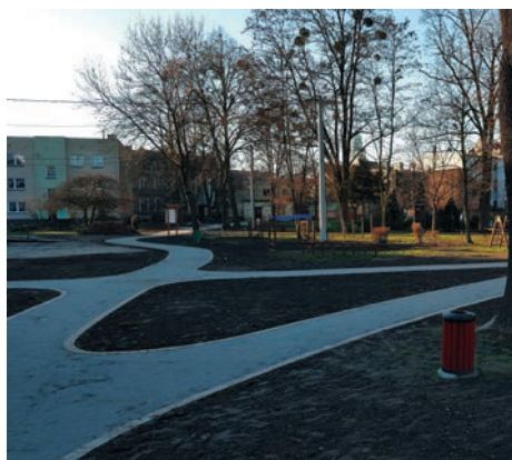
(dokończenie ze s. 3)

W ramach pozyskanego dofinansowania ze środków programu Działaj Lokalnie IX Polsko-Amerykańskiej Fundacji Wolności wołczyńska grupa Aktywni-Kreatywni prowadziła od lipca do października zajęcia sportowo-rekreacyjne dla mieszkańców. Dotychczasowe prace wykonane w parku sprawiły, że miejsce to jest nie do poznania. W planach gminy jest dalsza rozbudowa urządzeń zabawowych w parku oraz upiększanie terenu wokół stawu.