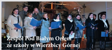
Zespół Pod Białym Orłem ze szkoły w Wierzbicy Górnej

Tradycyjnie w okresie Świąt Bożego Narodzenia w naszym mieście odbyło się wspólne kolędowanie dla wszystkich mieszkańców gminy Wołczyn, jak i ich świątecznych gości.