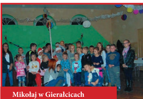
Mikołaj w Gieralcicach