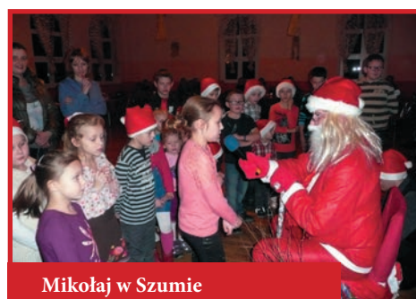
Mikołaj w Szumie