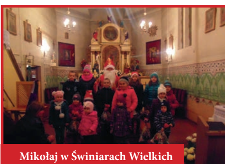
Mikołaj w Świniarach Wielkich