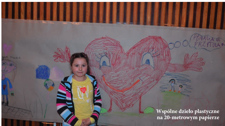
Wspólne dzieło plastyczne na 20-metrowym papierze