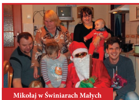
Mikołaj w Świniarach Małych