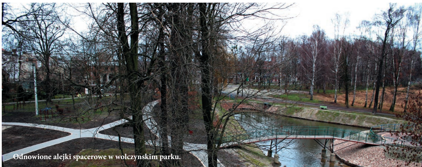
Odnowione alejki spacerowe w wołczyńskim parku.