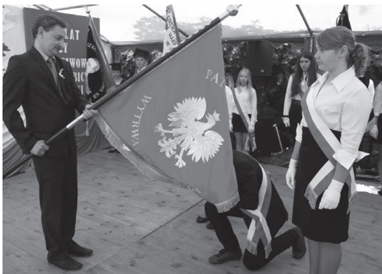
Nowy sztandar szkoły.