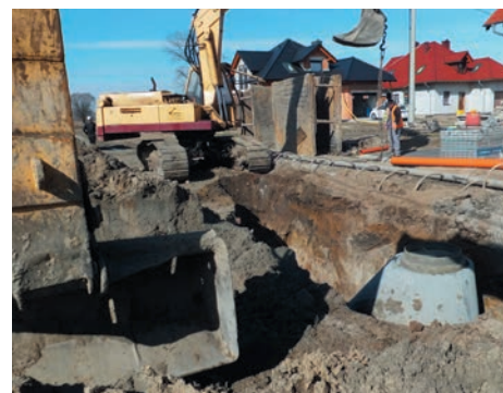
Budowa kanalizacji na osiedlu domów jednorodzinnych.