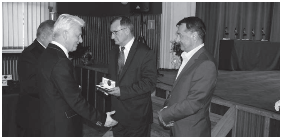
Podziękowania dla dyrektorów i kierowników zakładów pracy.