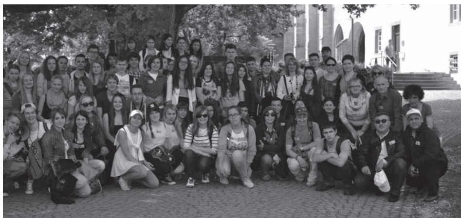
Wielonarodowościowa grupa projektu Comenius pod dębem przyjaźni w Lorch (Niemcy).

W czerwcu 2015 roku, w Publicznym Gimnazjum im. Jana Pawła II w Wołczynie dobiegła końca realizacja czwartego międzynarodowego projektu Comenius – uczenie się przez całe życie: Parki i ogrody w Europie – wczoraj i dziś.