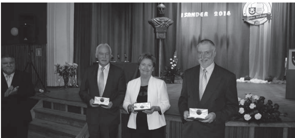
Podziękowania dla delegacji z partnerskiej gminy Hassloch.

dowcom, rzeszom działaczy ich pracy i wkładu w przebudowę naszej małej ojczyzny. Podziękował za inicjowanie przedsięwzięć, które podkreślają rolę samorządu. Bez ciężkiej pracy każdego dnia na rzecz społeczności lokalnej, nawet najbardziej wzniosłe wizje nie zostałyby wdrożone w życie.