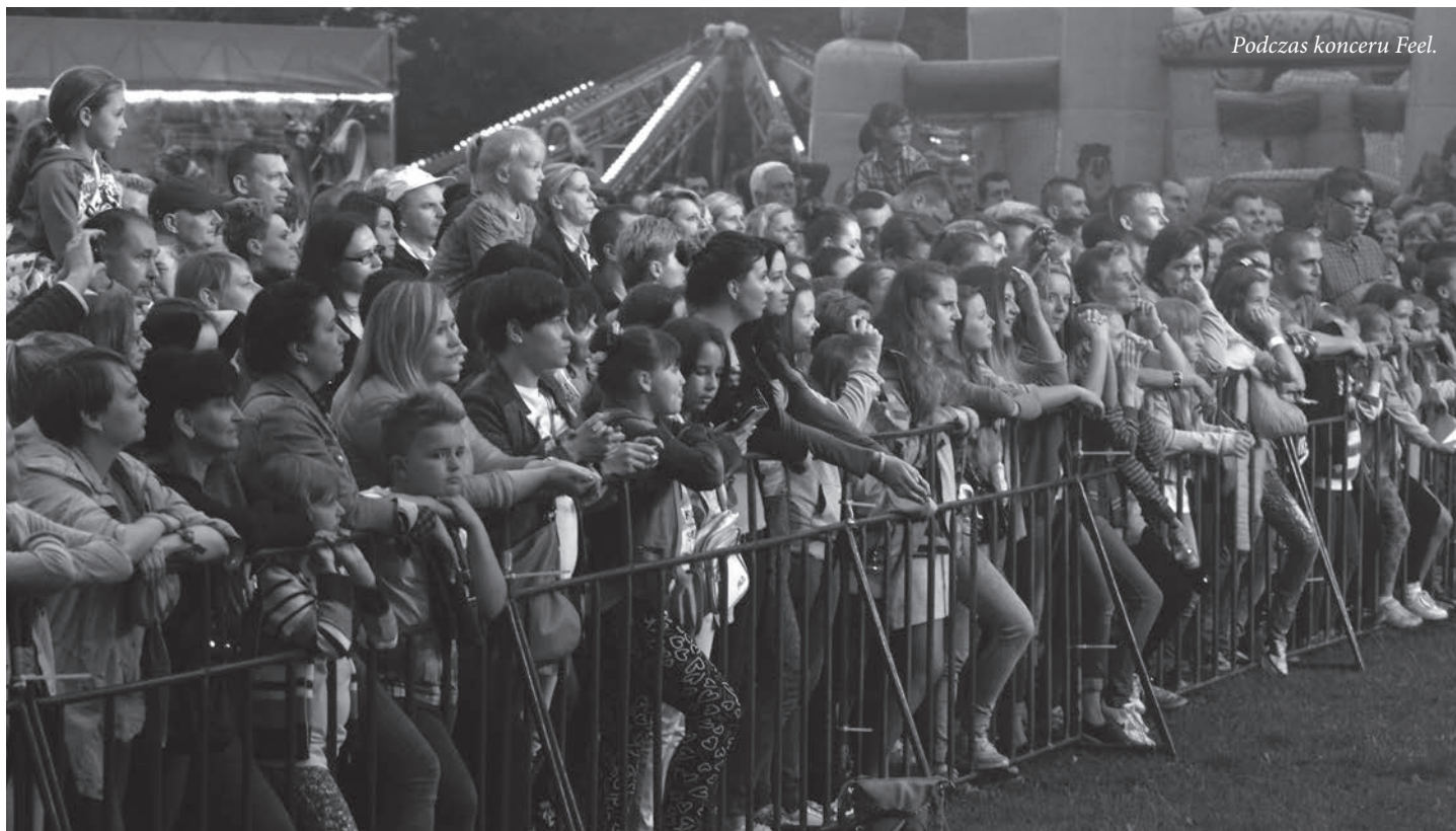
Podczas koncertu Feel.