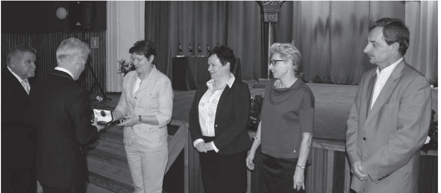
Podziękowania dla dyrektorów jednostek oświatowych.