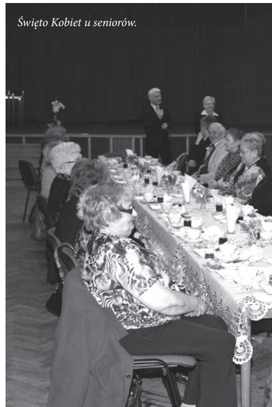
Święto Kobiet u seniorów.