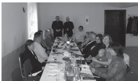
Święto Kobiet w Sołectwie Świniary Małe.