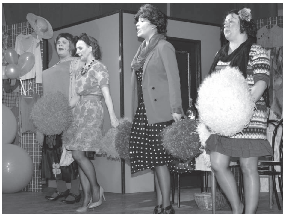
Spektakl „Szał menopauzy” z okazji Dnia Kobiet.

Tradycyjne w miesiącu marcu organizowane są gminne imprezy dla naszych pań z okazji Dnia Kobiet.