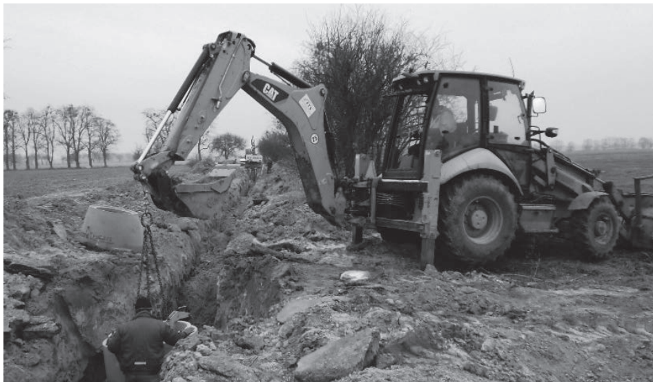
Budowa kanalizacji w Brzezinkach.

skąd dofinansowanie w wysokości 129.795 zł z Wojewódzkiego Funduszu Ochrony Środowiska i Gospodarki Wodnej w Opolu (całkowity koszt opracowania dokumentacji to 187.821 zł).