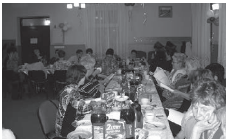
Święto Kobiet w Sołectwie Komorzno.