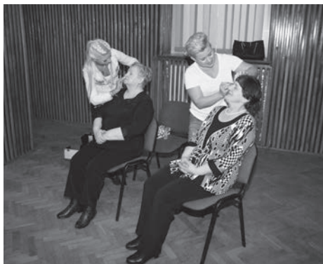
Święto Kobiet u seniorów - pokaz makijażu wiosennego.