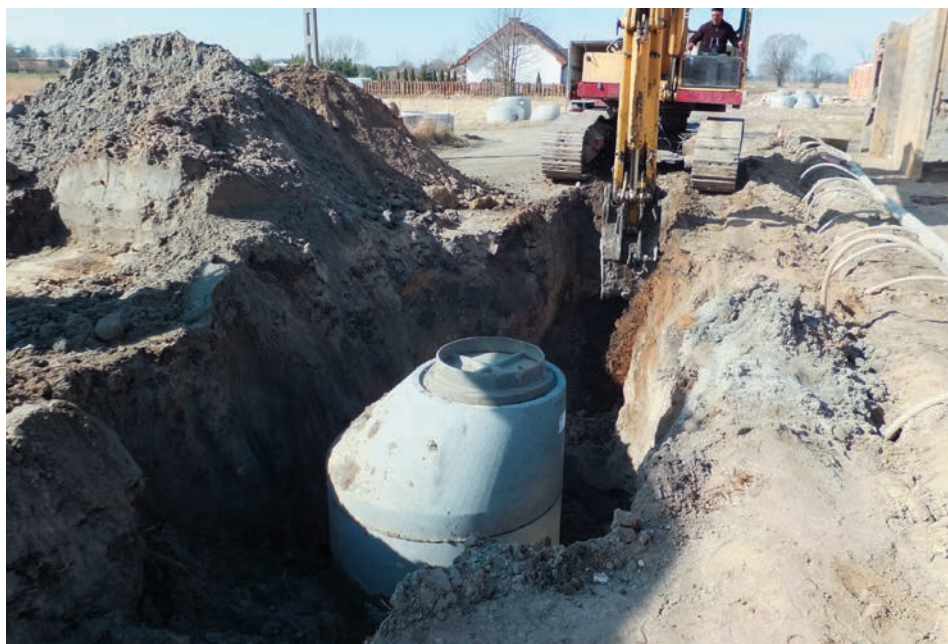
Budowa kanalizacji na osiedlu domów jednorodzinnych przy ul. Poznańskiej w Wołczynie.

Od grudnia 2014 r. Zakład Wodociągów i Kanalizacji Sp. z o. o. w Wołczynie realizuje budowę kanalizacji sanitarnej dla miejscowości Brzezinki. Zadanie to wykonywane jest przez Przedsiębiorstwo Inżynierii Wodnej i Ochrony Środowiska z Oleśnicy. Oprócz sieci kanalizacyjnej zbudowanych zostanie również 5 przepompowni (tłoczni) ścieków. Docelowo ścieki zostaną wprowadzone do układu kanalizacyjnego Wołczyna. Na to zadanie spółka uzyskała dofinansowanie z Programu Rozwoju Obszarów Wiejskich. Całkowity koszt zadania ma wynieść 4.154. 416,00 zł, z czego dofinanso-