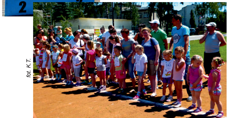
fol. K. T.