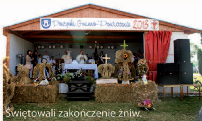
Świętowali zakończenie żniw.