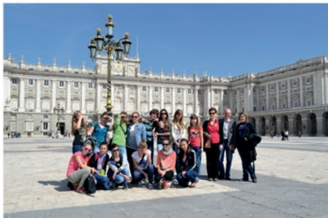
Madryt - Pałac Królewski