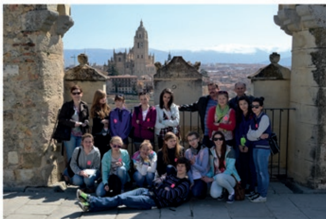
Segovia-na wieży alcazaru (islamskiego zamku)