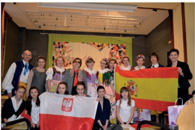
Madryt-prezentacja wołczyńskiej szkoły