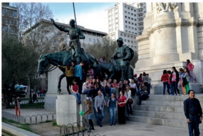
Madryt-pomnik Don Kichota i Sancho Pansy