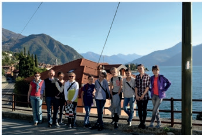
Menaggio (Włochy)-nad Jez. Como u podnóża Alp