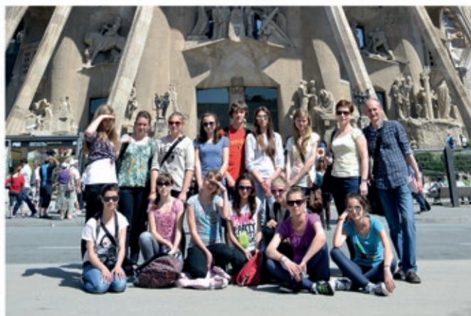
Barcelona-katedra Sagrada Familia (monumentalne dzieło Gaudiego)