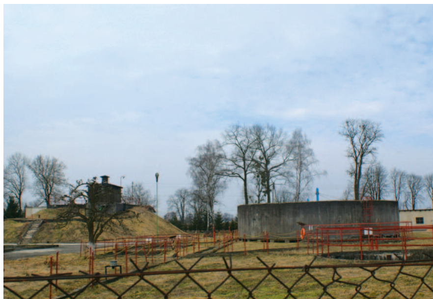
Oczyszczalnia - stan obecny

ścieków w Wołczynie. Planowana inwestycja obejmuje II-etapową rozbudowę istniejącej oczyszczalni do przepustowości 2775 m 3 /dobę. Pierwszy etap 1100 m 3 /dobę i w drugim etapie 1675 m 3 /dobę. Planowany termin zakończenia inwestycji to 15 grudzień 2013 r.