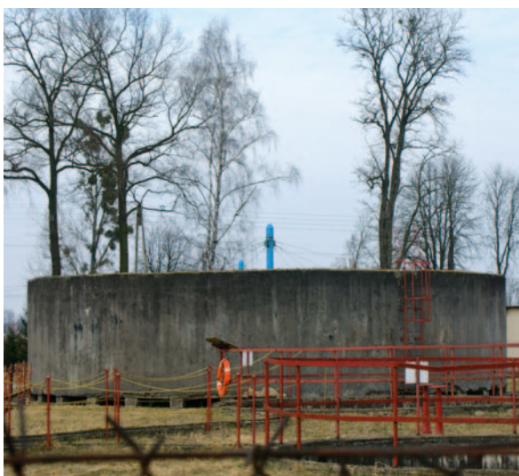
Oczyszczalnia - stan obecny

dami. Szacunkowa wartość projektu to 9 716 300,46 zł, pozyskane dofinansowanie to 5 184 931,97 zł. Celem ogólnym projektu jest poprawa jakości środowiska naturalnego i ochrona zbiorników wodnych poprzez przebudowę i rozbudowę oczyszczalni