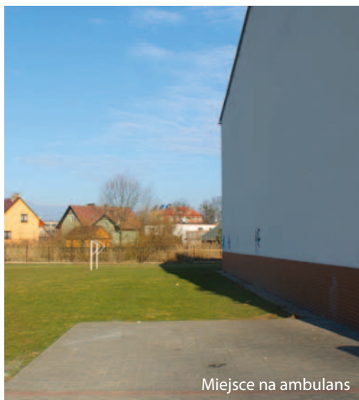
Miejsce na ambulans

Zbierano również podpisy pod petycją o przyznanie karetki, w ciągu 3 dni udało się ich zebrać ponad 5 tysięcy. Dzięki determinacji wszystkich zaangażowanych stron, w końcu się udało – będzie karetka w Wołczynie.