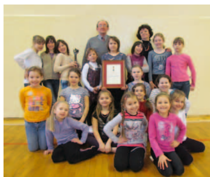
Zespół „Wielokropek” z Plastem Miodu.

W wyżej wymienionych eliminacjach, w czterech kategoriach wiekowych śpiewało około 160 młodych wykonawców z całej Polski.