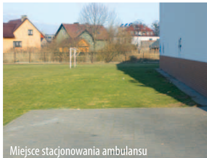
Miejsce stacjonowania ambulansu

Od lipca w Wołczynie będzie stacjonować karetka pogotowia ratunkowego od tak dawna oczekiwana przez lokalne społeczeństwo. Zespół ratownictwa będzie dyżurował w Wołczynie na początku w godzinach od 7.00 do 19.00. Wszyscy mają nadzieję, że w niedługim czasie zostanie przydzielona taka karetka całodobowo.