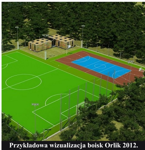
Przykładowa wizualizacja boisk Orlik 2012.