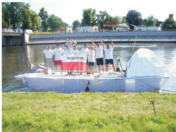
Tak prezentowało się „pływadło” wykonane przez wołczyńską młodzież.

16 - 17 czerwca tego roku odbyła się ósma edycja imprezy „Odra rzeką integracji europejskiej – Pływadło 2007”. Impreza ta polegała na zbudowaniu obiektu pływającego zwanego „pływadłem” wykonanego samodzielnie, bądź na bazie oryginalnego sprzętu i dopłynięcie na nim od linii startu do mety. Pod patronatem Burmistrza Wołczyna oraz pomocy lokalnych firm i przedsiębiorców grupa młodzieży z naszego miasta postanowiła zbudować „pływadło” i wziąć udział w spływie nurtami Odry z Raciborza do Kędzierzyna Koźła. Pływadło z Wołczyna zostało bardzo dobrze ocenione przez organizatorów w/w imprezy i zajęło 2 miejsce w swojej klasie zdobywając honorowy dyplom oraz nagrodę w wysokości 1600 zł ufundowaną przez Prezydenta Kędzierzyna-Koźła.