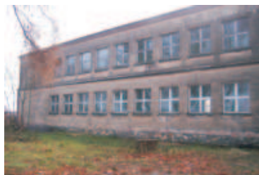
Budynek po byłej szkole w Markotowie Dużym

W kwietniu br., o czym już pisaliśmy gmina Wołczyn złożyła wniosek do BGK na dofinansowanie adaptacji dwóch budynków na mieszkania socjalne. Były to budynki po byłych szkołach w Markotowie Dużym i Wierzbicy Dolnej. Bank Gospodarstwa Krajowego przyznał gminie 420 tys. zł na dofinansowanie zaplanowanych adaptacji. Została już opracowana dokumentacja projektowa wraz z pozwoleniami na budowę. Planowane rozpoczęcie prac przewidziane jest na jesień tego roku. Cała inwestycja około 1,4 mln zł, ponad 30% dofinansuje BGK, a pozostałą część pokryje gmina z własnego budżetu. Plany przewidują adaptacje ośmiu lokali w Markotowie Dużym i siedmiu w Wierzbicy Dolnej. Pierwsi użytkownicy w/w lokali powinni dostać do nich klucze do lipca 2008 r.