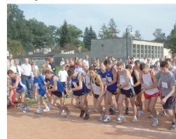
Uczestnicy biegu na starcie