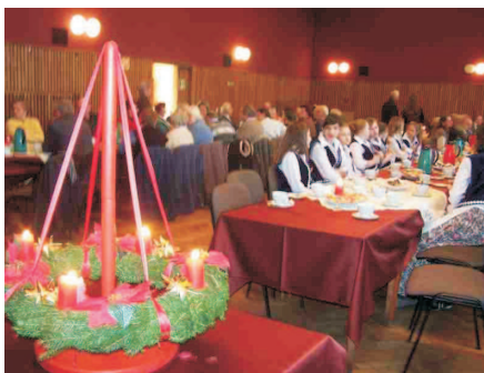
Adwentowy wieniec – symbol radosnego oczekiwania, jak co roku przyświeca ideji spotkań polsko-niemieckich

W czasie wspólnego kolędowania zaprezentował się także Zespół Pieśni i Tańca „Modrzewiaczy” i kluczborski chór dziecięcy „Bratek”.